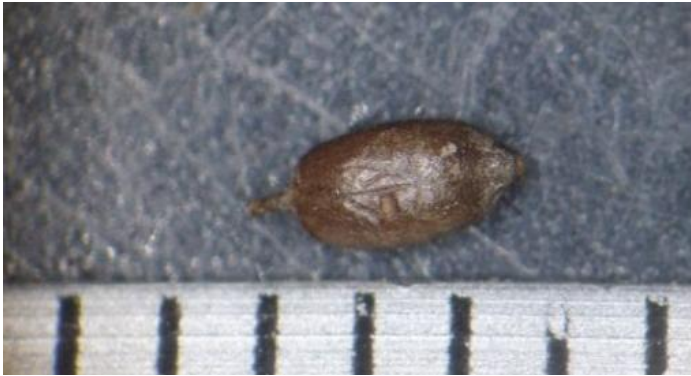
zaadje van de vloedzegge