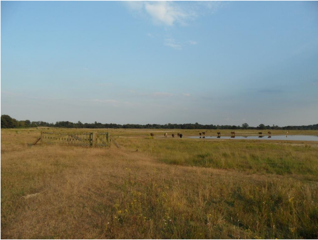
De savanne van de Plateaux