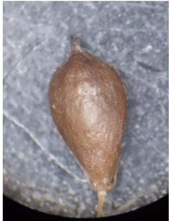
zaadje van de ruwe bies